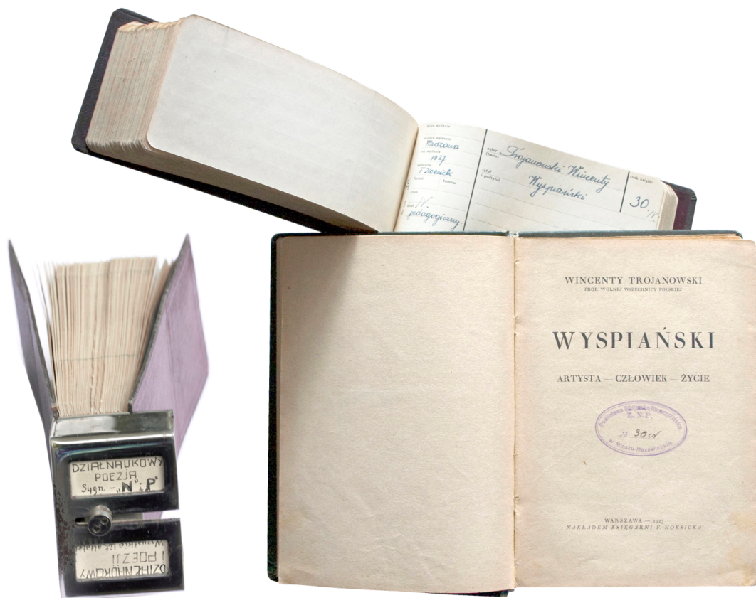
Fot. 2. Katalog działu naukowego i poezji przedwojennej Powiatowej Biblioteki Nauczycielskiej ZNP w Mińsku Mazowieckim, wraz z przykładową pozycją księgozbioru ze stemplem Biblioteki.